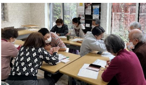
スマホ相談プログラム