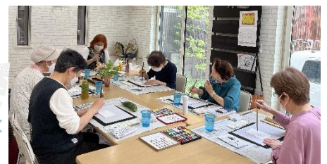
ゆくり庵絵手紙プログラム

水曜日と木曜日の 9:30～13:30 は藤沢市地域の縁側『ゆくり庵』も実施しています。