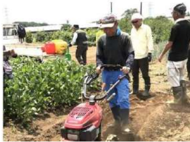
野菜作り・援農活動

地域には、趣味のサークル、楽しみながら社会貢献をすることができる団体、新しいことにチャレンジする学びの会など、様々な団体活動があります。