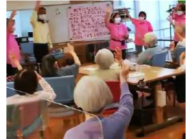
簡単手話と身振りで交流