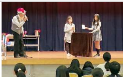
クリスマスマジックショー in 鶴沼公民館

ふるさとまつりに出演したり、夏休みには小学生を対象にマジックの指導を行ったり、ボランティアとして、福祉施設、老人会、子ども会などで活動しています。