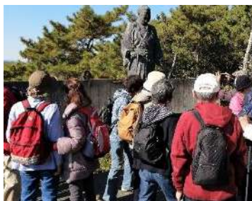
視覚障がい者の誘導奉仕活動

人生 100 年時代 に、 住み慣れた街で、 いつまでもいきいきと暮らしていきたい。 そのために、食生活や運動に 気を付けることはもちろんですが、 人との交流が大きな支えになる といわれています。