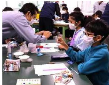
子どもに科学の楽しさを！