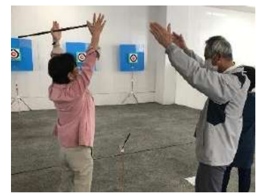
スポーツウエルネス吹矢

これから何か始めたいと思っている方と、地域で活動している団体の出会いの場 「地域で輝くシニアになろう！ 地域活動見本市」が 20 回目 を迎えます！