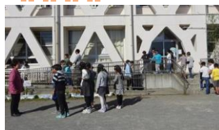
小学校での誘導講習