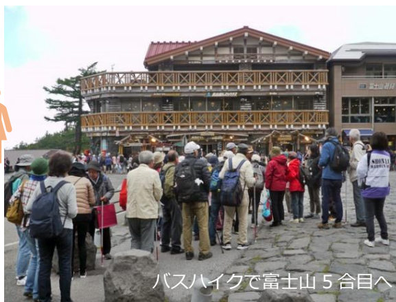
バスハイクで富士山5合目へ

毎月第一火曜日午後15時に太陽の家で定例会、更に誘導勉強会、年2回の全体懇親会を行っています。どなたでもいつでも入会できますが、入会後でも構いませんので、藤沢市点字図書館主催の「ボランティア基本講習」(毎年5~6月頃)の受講をお願いいたします。是非一度活動を見に来ませんか。