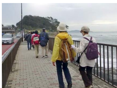
「歩く会」で稲村ヶ崎へ

毎月第一火曜日午後15時に太陽の家で定例会、更に誘導勉強会、年2回の全体懇親会を行っています。どなたでもいつでも入会できますが、入会後でも構いませんので、藤沢市点字図書館主催の「ボランティア基本講習」(毎年5~6月頃)の受講をお願いいたします。是非一度活動を見に来ませんか。